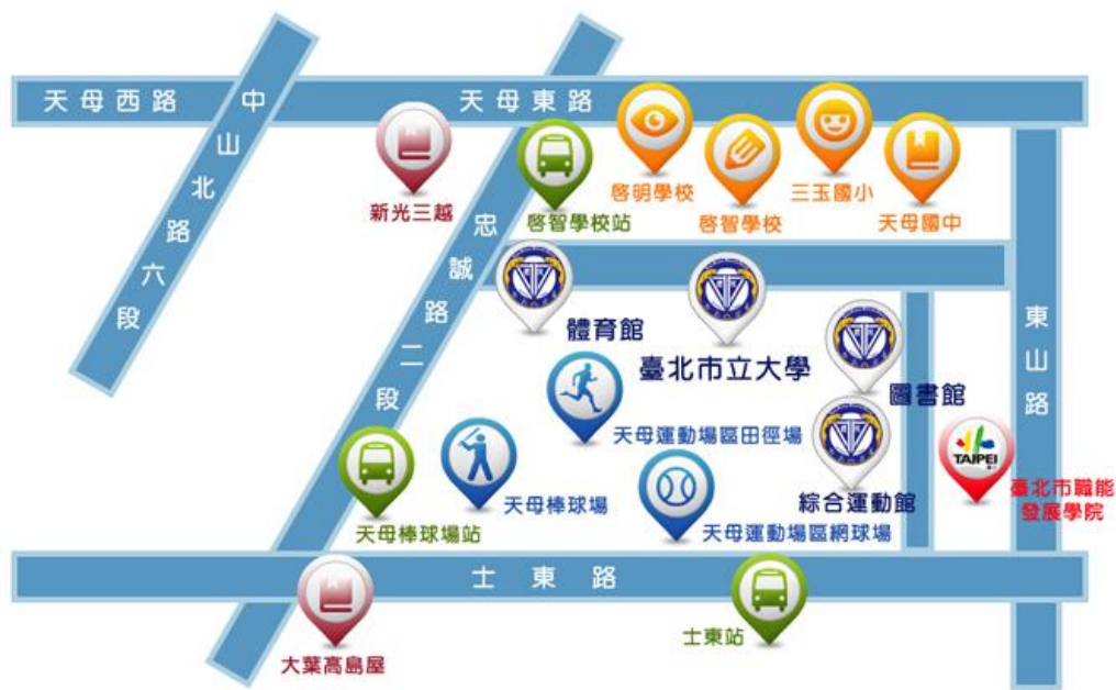
八、天母校區校園平面圖